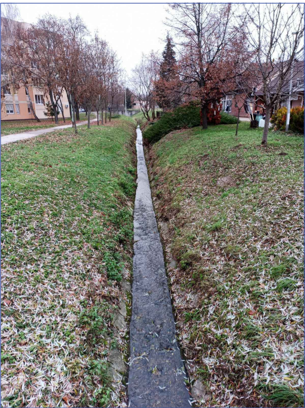
Jelenlegi állapot (étterem környezete)