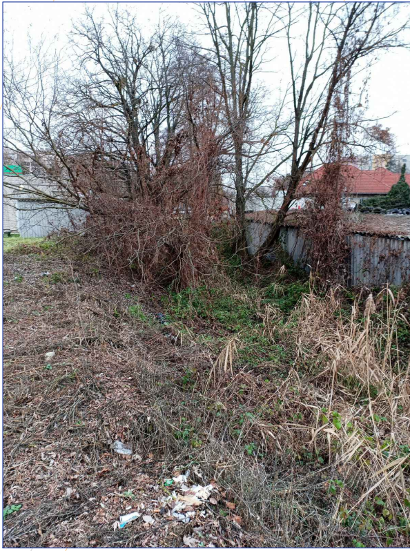
Jelenlegi állapot (MOL és gumis között)