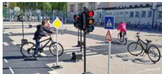
Önkormányzati mobil KRESZ pálya

A tesztidőszakban ún. bicibusz programra is sor került, amely a város egyes pontjairól kerékpárral becsatlakozó gyerekeket kíserte el az iskoláig a tanítási napokon (9 napon keresztül) kerékpározó pedagógus kísérettel 4 útvonalon.