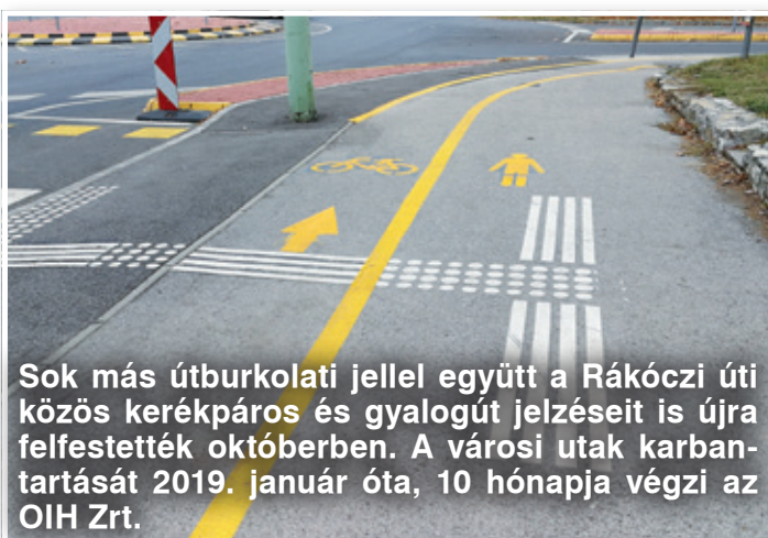
Sok más útburkolati jellel együtt a Rákóczi úti közös kerékpáros és gyalogút jelzéseit is újra felfestették októberben. A városi utak karbantartását 2019. január óta, 10 hónapja végzi az OIH Zrt.