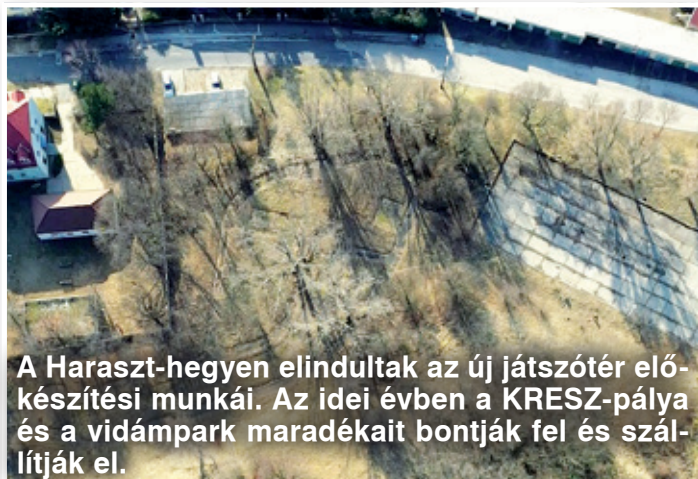
A Haraszt-hegyen elindultak az új játszótér előkészítési munkái. Az idei évben a KRESZ-pálya és a vidámpark maradványait bontják fel és szállítják el.