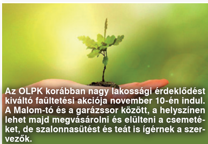
Az OLPK korábban nagy lakossági érdeklődést kiváltó faültetési akciója november 10-én indul. A Malom-tó és a garázssor között, a helyszínen lehet majd megvásárolni és elültetni a csemetéket, de szalonnasütést és teát is ígérnek a szervezők.

Az oroszlányiak már számos esetben bizonyították, hogy egy jó ügyért igenis képesek összefogni. Ez esetben mindenki maga határozza meg, mekkora mértékben tud hozzájárulni a nemes ügghöz – amely túlmutat a város, sőt az ország határain is.