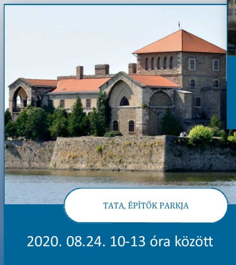
TATA, ÉPÍTŐK PARKJA