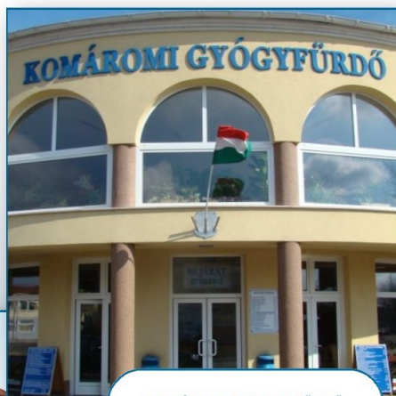
KOMÁROM, BRIGETIO FÜRDŐ