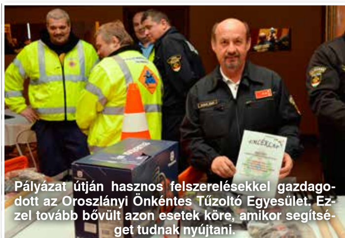
Pályázat útján hasznos felszerelésekkel gazdagodott az Oroszlányi Önkéntes Tűzoltó Egyesület. Ezzel tovább bővült azon esetek köre, amikor segítséget tudnak nyújtani.

Fenti címmel rendeztek konferenciát kedden a polgármesteri hivatalban a városi humán erőforrás-fejlesztési stratégiáról, amelyre a városi ipari parkjában letelepedett cégek HR-es képviselői, intézményvezetők voltak hivatalosak, illetve Lazók Zoltán polgármester mellett jelen volt Borsó Tibor, a megyei közgyűlés alelnöke is.