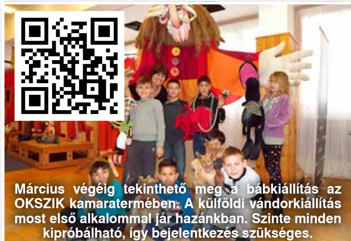
Március végéig tekinthető meg a bábkiállítás az OKSZIK kamaratermében. A külföldi vándorkiállítás most első alkalommal jár hazánkban. Szinte minden kipróbálható, így bejelentkezés szükséges.