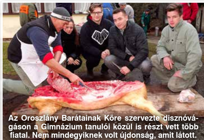
Az Oroszlány Barátainak Köre szervezte disznóvágáson a Gimnázium tanulói közül is részt vett több fiatal. Nem mindegyiknek volt újdonság, amit látott.