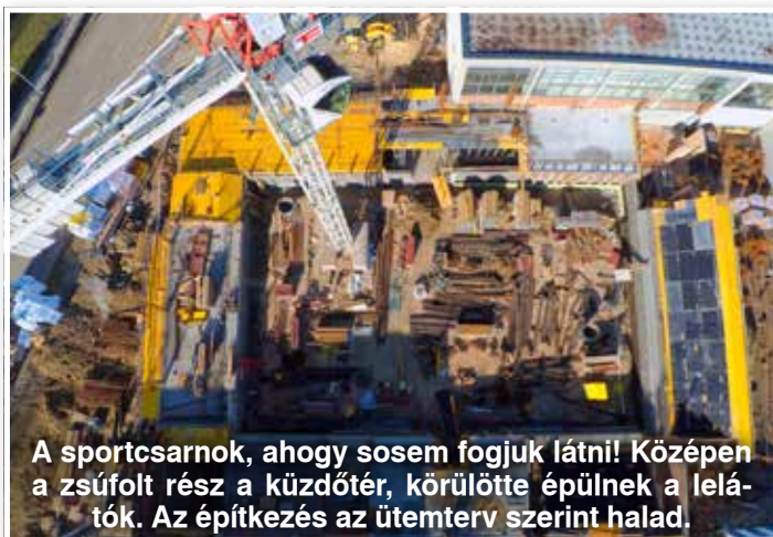
A sportcsarnok, ahogy sosem fogjuk látni! Középen a zsúfolt rész a küzdőtér, körülötte épülnek a lelátók. Az építkezés az ütemterv szerint halad.