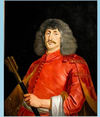
3. Zrínyi Miklós költő és hadvezér születésének 400. évfordulója.