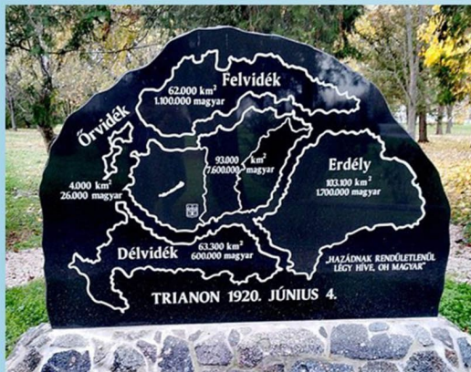
4. A trianoni békeszerződés 100. évfordulója.