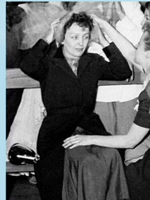
5. 100 éve született Édith Piaf.