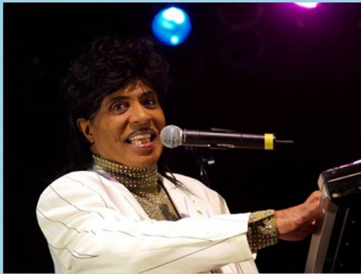
1. Meghal Little Richard, amerikai énekes, dalszerző, zongorista.

A megoldásokat a szinter@oroszlany.hu email címre kérjük küldeni.