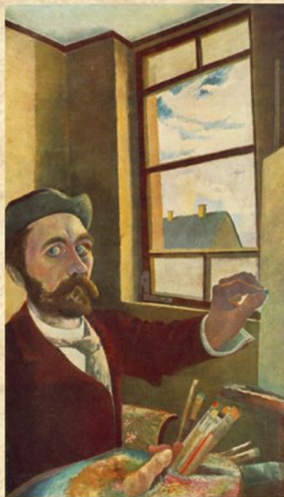
1. Vincent Van Gogh

A megoldásokat a szinter@oroszlany.hu email címre kérjük küldeni.