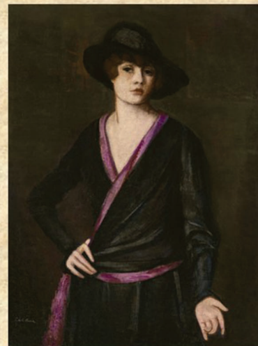
4. Frida Kahlo