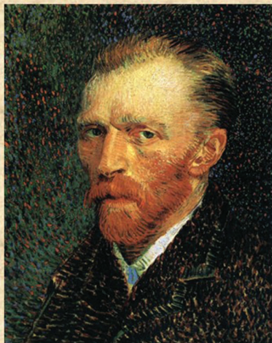
2. Csontváry Kosztka Tivadar