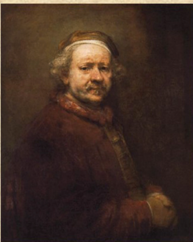
7. Albrecht Dürer