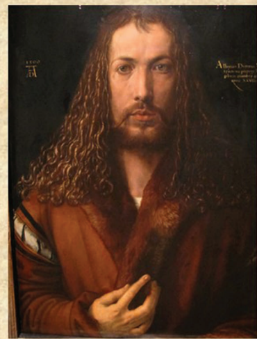
6. Rembrandt van Rijn