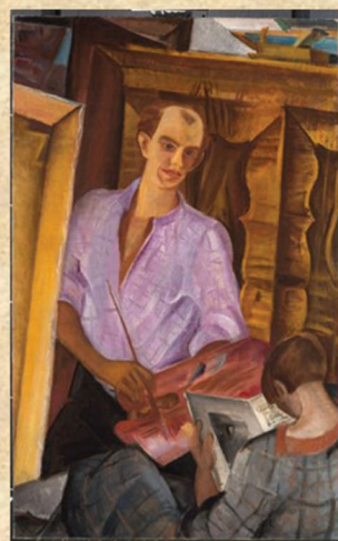
5. Pablo Picasso