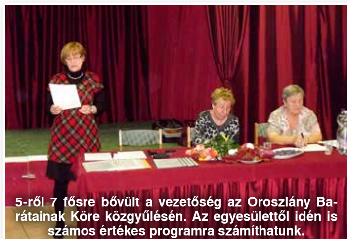
5-ről 7 főre bővült a vezetőség az Oroszlány Barátainak Köre közgyűlésén. Az egyesülettől idén is számos értékes programra számíthatunk.