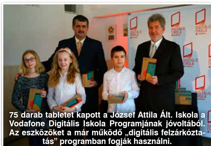
75 darab tabletet kapott a József Attila Ált. Iskola a Vodafone Digitális Iskola Programjának jóvoltából. Az eszközöket a már működő „digitális felzárkóztatás” programban fogják használni.