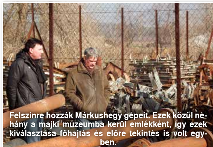
Felszínre hozzák Márkushegy gépeit. Ezek közül néhány a majki múzeumba kerül emlékként, így ezek kiválasztása főhajtás és előre tekintés is volt egyben.