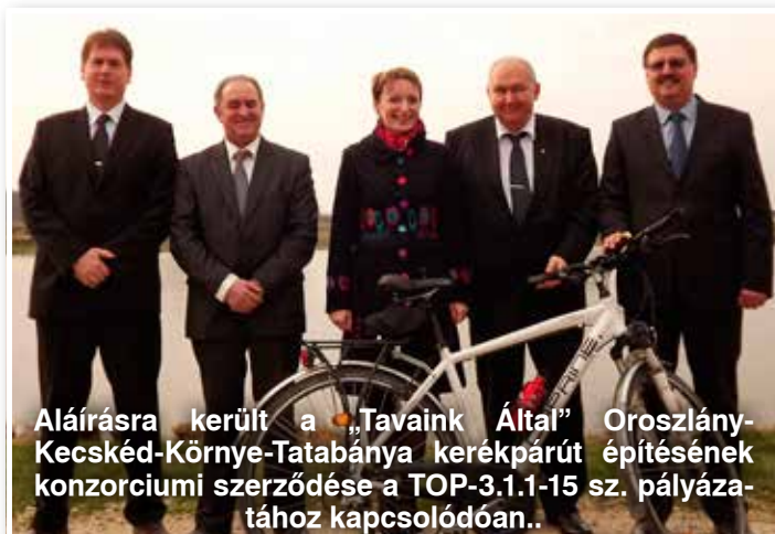
Alíráásra került a „Tavaink Átal” Oroszlány-Kecskéd-Környe-Tatabánya kerékpárút építésének konzorciumi szerződése a TOP-3.1.1-15 sz. pályázatához kapcsolódóan.