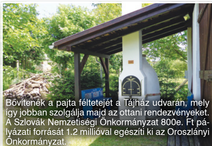
Bővítenék a pajta féltetejét a Tájház udvarán, mely így jobban szolgálja majd az ottani rendezvényeket. A Szlovák Nemzetiségi Önkormányzat 800e. Ft pályázati forrását 1.2 millióval egészíti ki az Oroszlányi Önkormányzat.