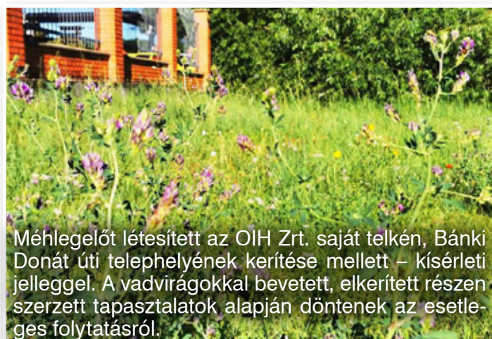
Méhlegelőt létesített az OIH Zrt. saját telkén, Bánki Donát úti telephelyének kerítése mellett – kísérleti jelleggel. A vadvirágokkal bevetett, elkerített részen szerzett tapasztalatok alapján döntenek az esetleges folytatásról.