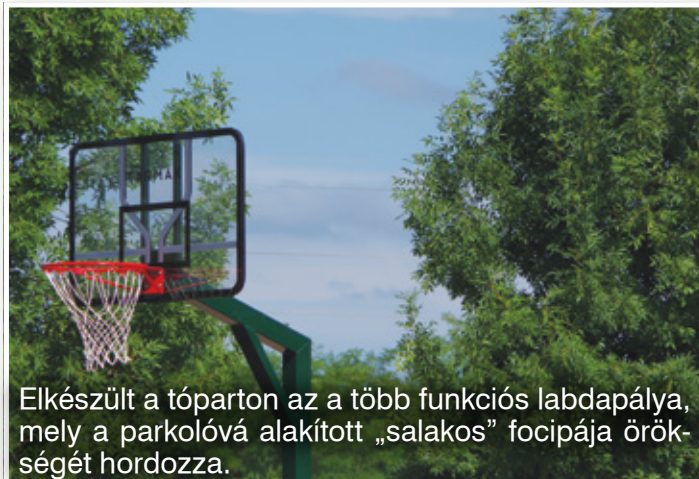
Elkészült a tóparton az a több funkciós labdapálya, mely a parkolóvá alakított „salakos” focipálya örökségét hordozza.