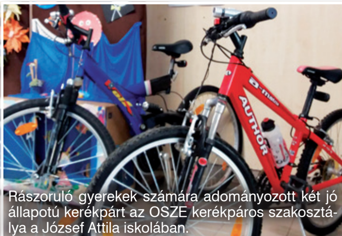
Rászoruló gyerekek számára adományozott két jó állapotú kerékpárt az OSZE kerékpáros szakosztálya a József Attila iskolában.