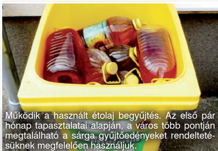
Működik a használt étolaj begyűjtés. Az első pár hónap tapasztalatai alapján, a város több pontján megtalálható a sárga gyűjtőedényeket rendeltetésüknek megfelelően használjuk.