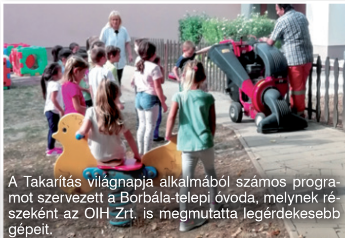
A Takarítás világnapja alkalmából számos programot szervezett a Borbála-telepi óvoda, melynek részeként az OIH Zrt. is megmutatta legérdekesebb gépeit.