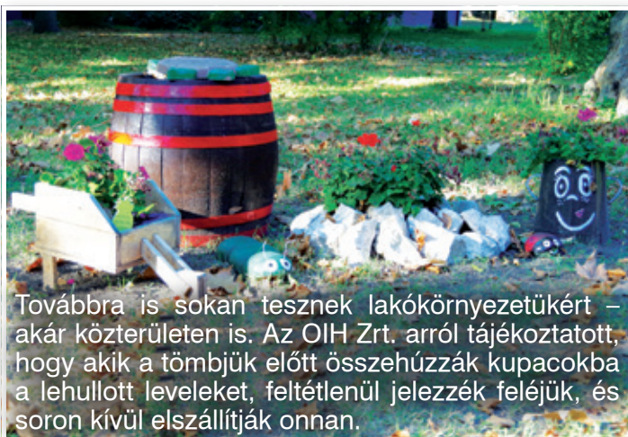
Továbbra is sokan tesznek lakókörnyezetükért – akár közterületen is. Az OIH Zrt. arról tájékoztatott, hogy akik a tömbjük előtt összehúzzák kupacokba a lehullott leveleket, feltétlenül jelezzék feléjük, és soron kívül elszállítják onnan.