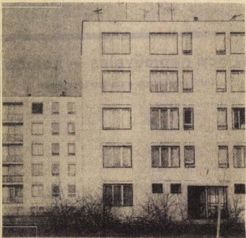
„A tömbházakban 3200 lakás van...”

Három ifjúsági vezetőt kérdeztünk meg, hogy a fiatalok városában milyen tennivalókat helyeznének