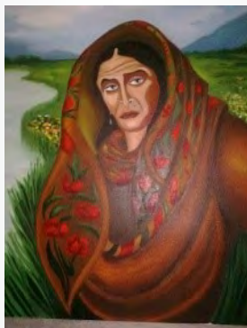
Farkas Ervin alkotása