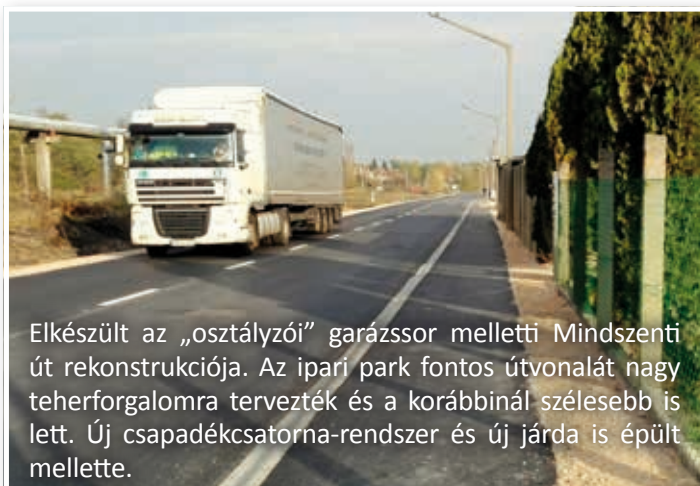
Elkészült az „osztályzó” garázsor melletti Mindszenti út rekonstrukciója. Az ipari park fontos útvonalát nagy teherforgalomra tervezték és a korábbinál szélesebb is lett. Új csapadékcatorna-rendszer és új járda is épült mellette.