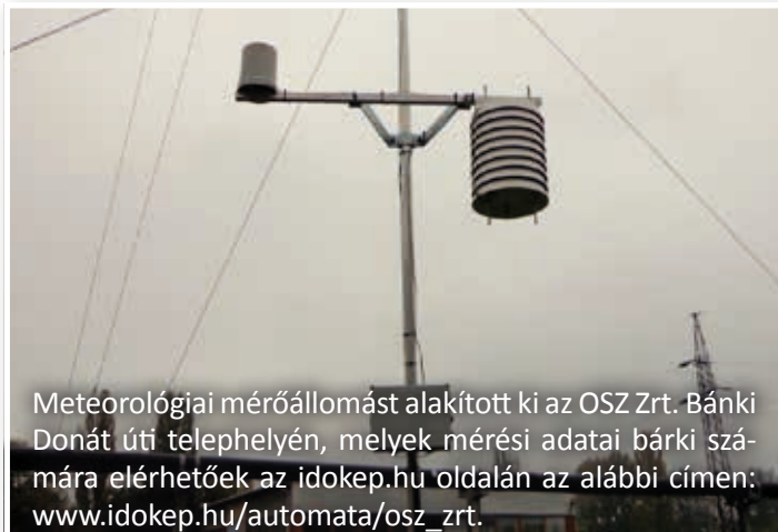
Meteorológiai mérőállomást alakított ki az OSZ Zrt. Bánki Donát úti telephelyén, melyek mérési adatai bárki számára elérhetőek az idokep.hu oldalán az alábbi címen: www.idokep.hu/automata/osz_zrt .