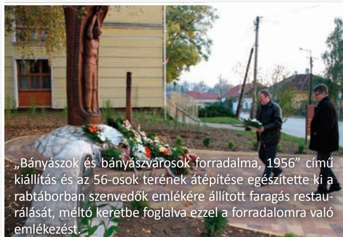
„Bányászok és bányászvárosok forradalma, 1956” című kiállítás és az 56-osok terének átépítése egészítette ki a rabtáborban szenvedők emlékére állított faragás restaurálását, méltó keretbe foglalva ezzel a forradalomra való emlékezőt.