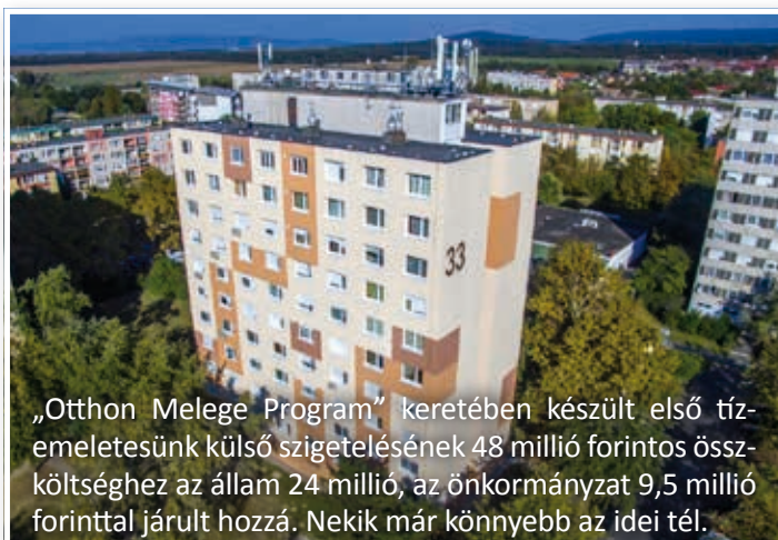
„Otthon Melege Program” keretében készült első tízelemlésünk külső szigetelésének 48 millió forintos összköltséghez az állam 24 millió, az önkormányzat 9,5 millió forinttal járult hozzá. Nekik már könnyebb az idejél.