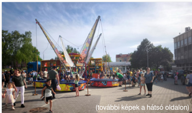
(további képek a hátsó oldalon)

A Városi Gyereknap ismét bebizonyította, hogy a közös élmények, a mozgás, a játék és a kulturális programok egyaránt fontos szerepet töltenek be a családok életében. A rendezvény jó hangulatban, sok mosollyal és felejthetetlen pillanatokkal gazdagította az oroszlányi gyermekeket és szülőiket.