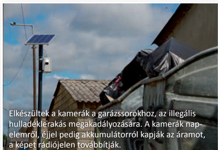
Elkészültek a kamerák a garázssorokhoz, az illegális hulladéklerakás megakadályozására. A kamerák napemlérről, éjjel pedig akkumulátorról kapják az áramot, a képet rádiójelen továbbítják.