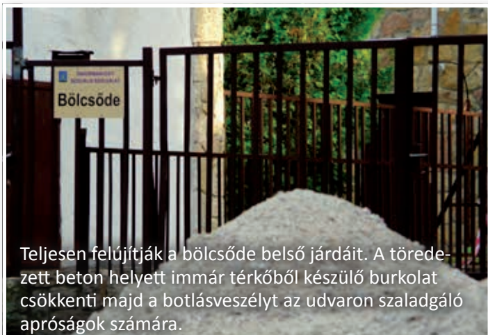
Teljesen felújítják a bölcsőde belső járdáit. A töredezett beton helyett immár térkőből készülő burkolat csökkenti majd a botlásveszélyt az udvaron szaladgáló apróságok számára.