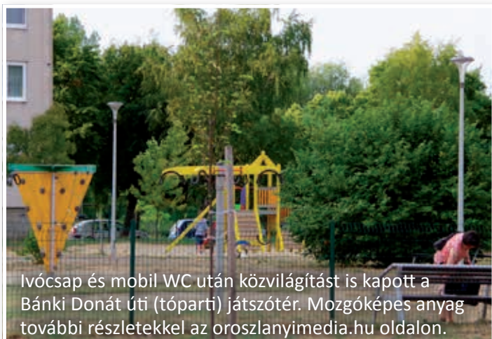
Ivócsap és mobil WC után közvilágítást is kapott a Bánki Donát úti (tóparti) játszótér. Mozgóképes anyag további részletekkel az oroszlanyimedia.hu oldalon.