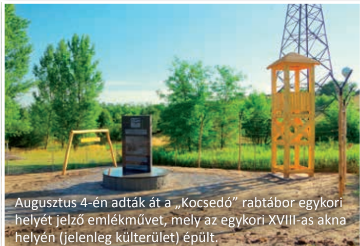
Augusztus 4-én adták át a „Kocsedó” rabtábor egykori helyét jelző emlékművet, mely az egykori XVIII-as akna helyén (jelenleg külterület) épült.