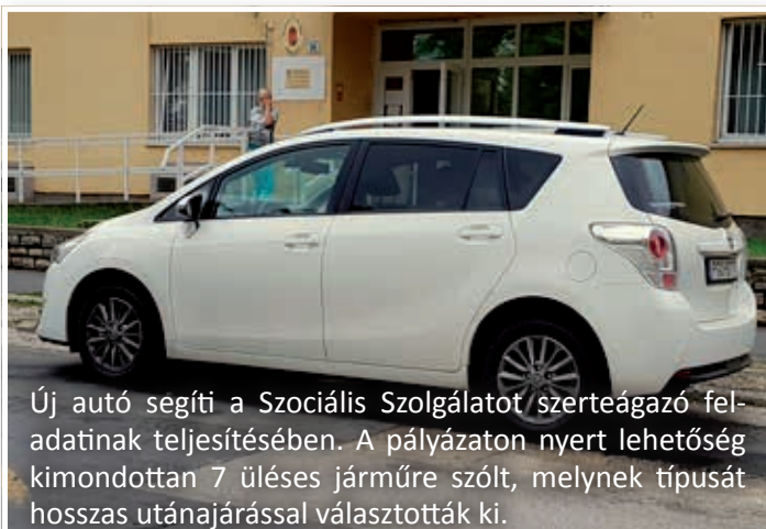
Új autó segíti a Szociális Szolgálatot szerzteágazó feladatának teljesítésében. A pályázaton nyert lehetőség kimondottan 7 üléses járműre szólt, melynek típusát hosszas utánajárással választották ki.