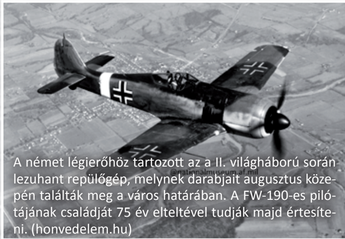
A német légierőhöz tartozott az a II. világháború során lezuhant repülőgép, melynek darabjait augusztus közepén találták meg a város határában. A FW-190-es pilótájának családját 75 év elteltével tudják majd értesíteni. (honvedelem.hu)