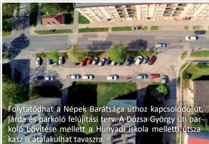
Folytatódhat a Népek Barátsága úthoz kapcsolódó út, járda és parkoló felújítási terv. A Dózsa György úti parkoló bővítése mellett a Hunyadi iskola melletti útszakasz is átalakulhat tavaszra.