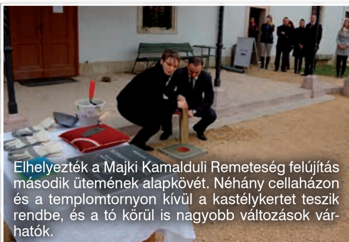
Elhelyezték a Majki Kamalduli Remeteség felújítás második ütemének alapkövét. Néhány cellaházon és a templomtornyon kívül a kastélykertet teszik rendbe, és a tó körül is nagyobb változások várhatók.