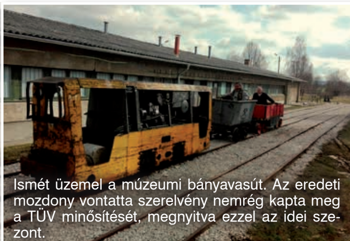
Ismét üzemel a múzeumi bányavasút. Az eredeti mozdony vontatta szerelvény nemrég kapta meg a TÜV minősítését, megnyitva ezzel az idei szezon.