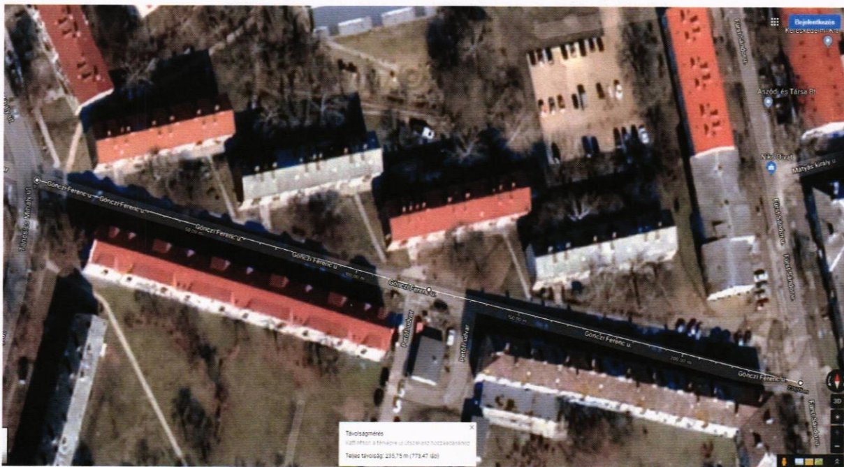
Gönczi Ferenc utca, jobb útpálya

A különbséget a Gönczi Ferenc utcai szennyvíz rekonstrukció keretében, a gördülő fejlesztési tervből megvalósuló felpályás úthelyreállítással párhuzamosan, az utca másik (menetirány szerinti jobb pálya, jelenleg parkolásra használt és továbbra is annak javasolt) felpályájának lokális alépítmény megerősítésére (pontos helyszíni felmérés és feltárás során), és a teljes érintett felpályán az aszfaltfelület változó vastagságú profilmarása és 6 cm AC-11 aszfaltkeverékkel történő burkolására kerüljön felhasználásra. Ezzel a rendkívül rossz állapotú, mintegy 240 fm hosszú felpályás útszakasz szintén teljes felújításra kerülhetne (240 fm * 3 m = 720 m 2 ).