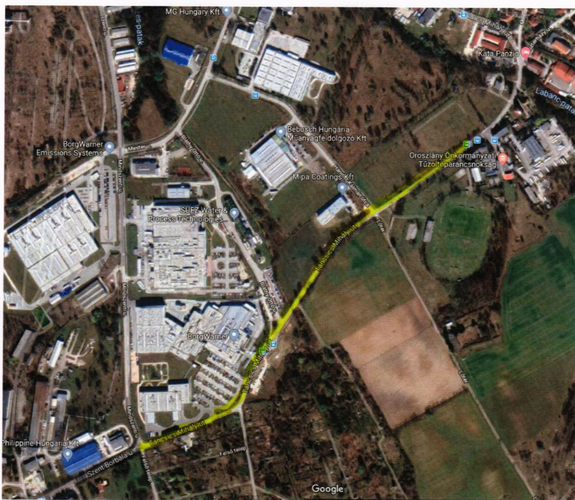
Meglévő járda felújítása/újjaépítése és új járdaszakasz építése

Ezzel a kivitelezéssel az Ipari Park biztonságos gyalogos forgalma megoldódik és folytonossá válik.